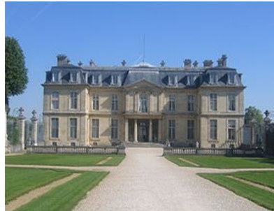
Château de Champs-sur-Marne